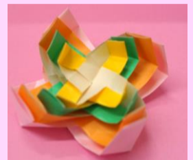
図3 吹きこま4枚もの

左のこまは折り紙1枚から出来ており、4枚の羽根が付いているので風を受けやすく良く回ります。図3のこまは、同じ作品をサイズを変えて作成し4つ重ねてあります。1つずつでも回すことができますが、重ねて回すと色合いがとてもキレイです。