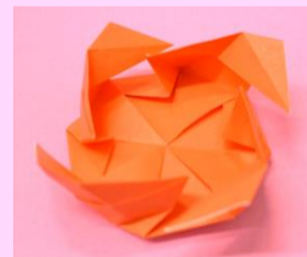
図2 吹きこま1枚もの

上段・中絶・下段の3つの部品を作って組み合わせます。簡単に作れてよく回る、折り紙のこまの代表的な作品です。