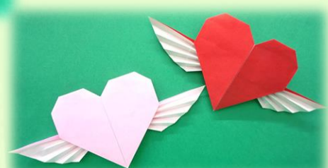
《愛の翼に乗って》 ハートも羽根も合わせて1枚で折っています