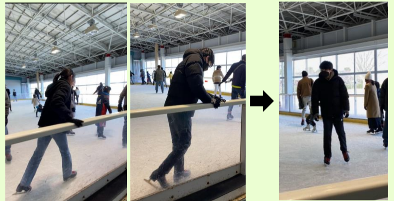
【子鹿ちゃんのように…】➡【なんと！滑れるように】

ウィンタースポーツと言えばスキーやスノーボードですが、アイススケートも楽しそうでしたよ！