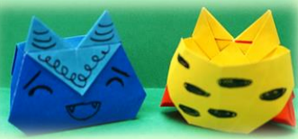
《オニさんのまめ入れ》 後ろはオニのパンツになっています