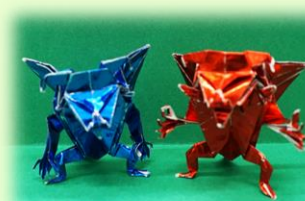
《悪魔》 15cm折り紙で折って身長は4cmくらいです